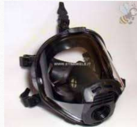
Pieno facciale (non assistito)